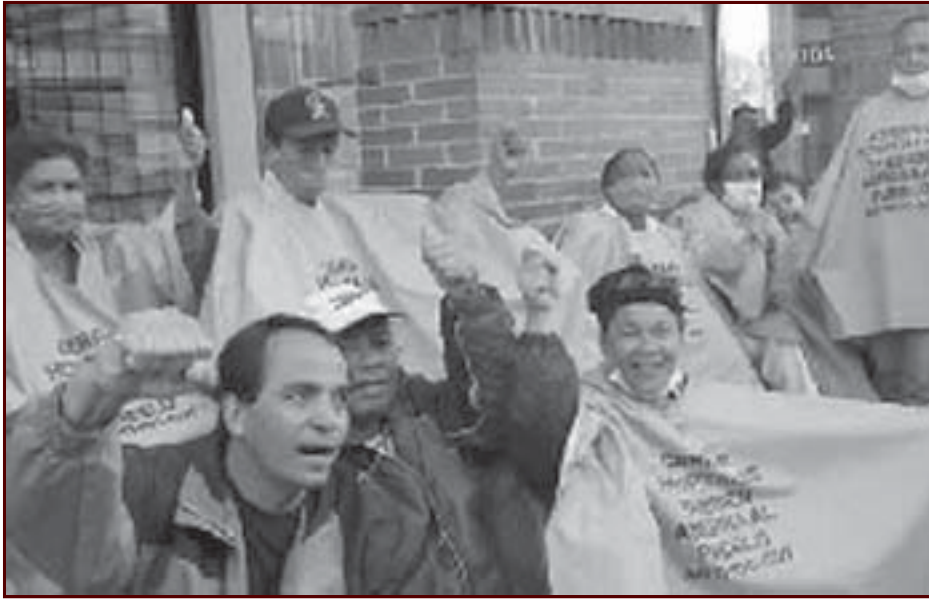
¡Viva la Toma! ¡Viva la Lucha en Defensa de la Salud del Pueblo!

El martes 18 de noviembre, fueron desalojados de las instalaciones del ministerio de “protección social” los trabajadores de la salud organizados en Anthoc. Entre la una y las dos de la mañana, los perros de presa del Estado (aproximadamente 400 de la ESMAD –Robocops-) sacaron a la fuerza a los huelguistas luego de ocho días en los cuales hicieron sentir su deseo de luchar para evitar que continúe el cierre de hospitales y la privatización y mercantilización de la salud. El régimen terrorista y paramilitar de Uribe Vélez ha respondido como siempre: con brutal represión a la resistencia de las masas. La junta directiva de Anthoc decidió “continuar la lucha” bajo la forma parlamentaria con la intermediación del “polo democrático independiente”, el nuevo esperpento pacifista, reformista y socialdemócrata.