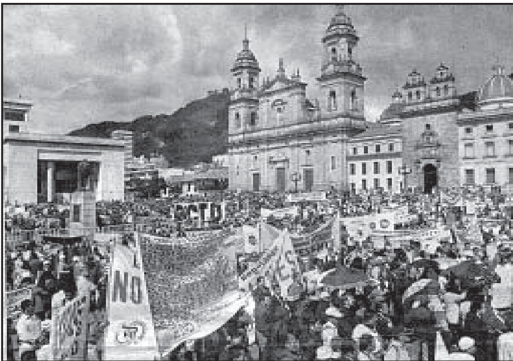
Paro del 16 de septiembre de Bogotá (Plaza de Bolívar)