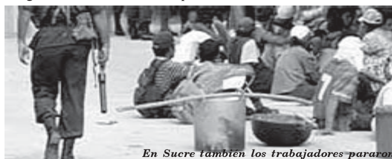
En Sucre también los trabajadores pararon

Con una nutrida presencia se realizó el paro de trabajadores en Manizales las consignas se centraron en contra de las medidas adoptadas por el reaccionario gobierno de Álvaro Uribe Vélez en cuanto al pago de las primas extralegales a las que tienen derecho todos los empleados del sector público, en contra de la reforma prestacional y pensional, la reforma laboral y los decretos de conmoción interior y el no pago de las primas extralegales a mitad de año. No podían faltar allí los estudiantes, trabajadores del sector público, padres de familia, docentes, líderes sindicales y la ciudadanía en general quienes mostraron su indignación con las medidas represivas del nuevo títere de turno.