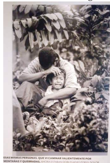
ESAS MISMAS PERSONAS, QUE VI CAMINAR VALIENTEMENTE POR MONTAÑAS Y QUERRADAS, AHORA ESTABAN DOBLADAS POR EL DOLOR.

En cada una de las cuatro salas que ocupan la exposición de Jesús Abad Colorado, se siente en el ambiente y se ve en los rostros y expresiones de