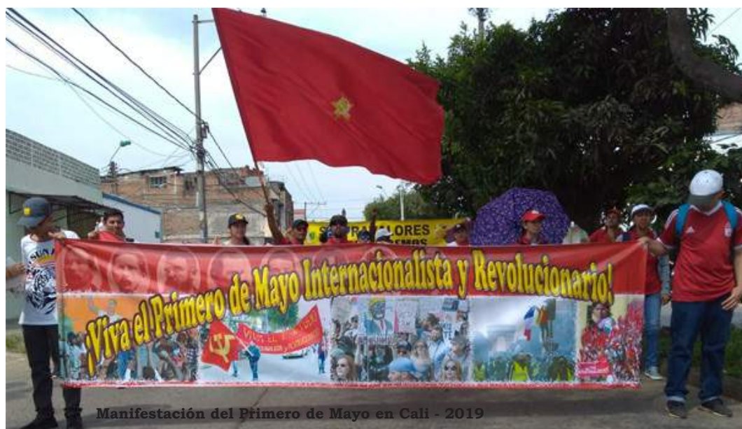
Manifestación del Primero de Mayo en Cali - 2019

El sistema imperialista continúa atravesando una profunda crisis. Los intentos imperialistas y reaccionarios actuales de enfrentarla y superarla son infructuosos y va a profundizarse y extenderse.