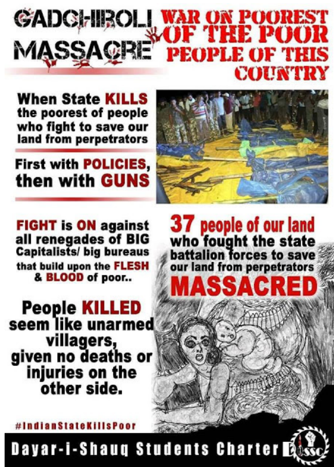
Poster. Las evidencias de falso encuentro en Gadchiroli.

Comité Internacional de Apoyo a la Guerra Popular en India info csgpindia@gmail.com 04/26/2018