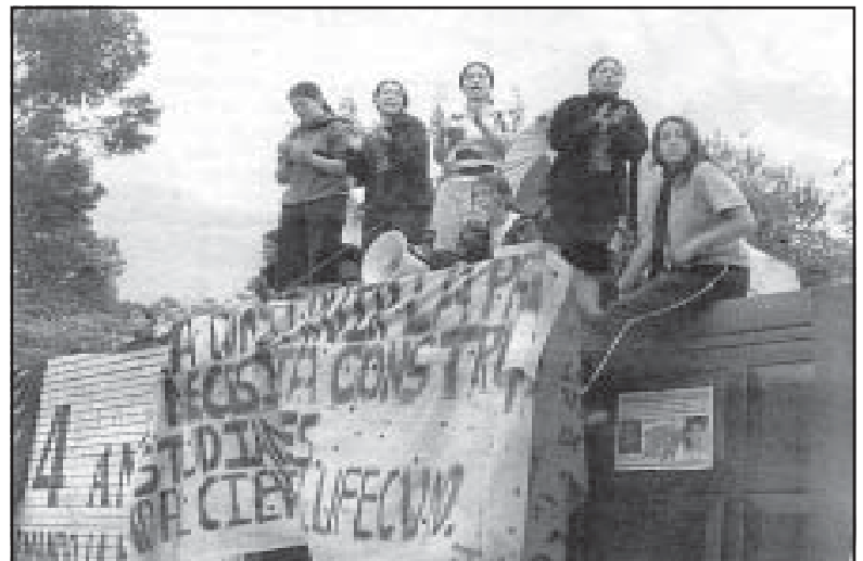
Estudiantes del Liceo Femenino en Bogotá en protesta por el derecho a la Educación Pública

De otro lado algunos compañeros honestos, que ocupan puestos dirigentes en las organizaciones de masas seguirán engañados por algún tiempo y apoyarán las tácticas de los concertadores. Pero como la "concertación" es, en el fondo, traición a los intereses de las masas, tanto éstas como los dirigentes honestos, en la práctica, se convencerán de quién tiene razón. Lo que aquí está planteado es la lucha entre las tendencias "concertadoras", "conciliadoras" de algunos dirigentes, y el espíritu de lucha de las masas; entre 25 años de resignación y la decisión de luchar; entre la lucha de clases y la conciliación de clases. Y esta lucha se agudizará en la misma medida en que se agudice la lucha de clases, que, al fin y al cabo, es el motor de la historia. ♪