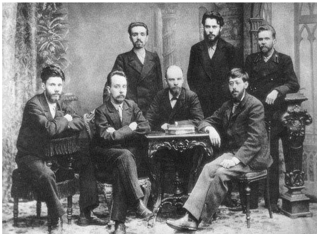
Unión de Lucha por la Emancipación de la Clase Obrera, San Petersburgo, diciembre de 1895.