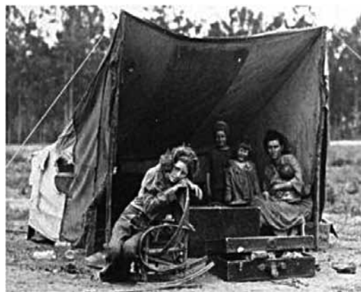
Choza de desplazados de las planicies de Oklahoma, 1931

750.000 fincas a los granjeros norteamericanos para entregarlos a los bancos y los capitalistas agrícolas entre 1930 y 1935.