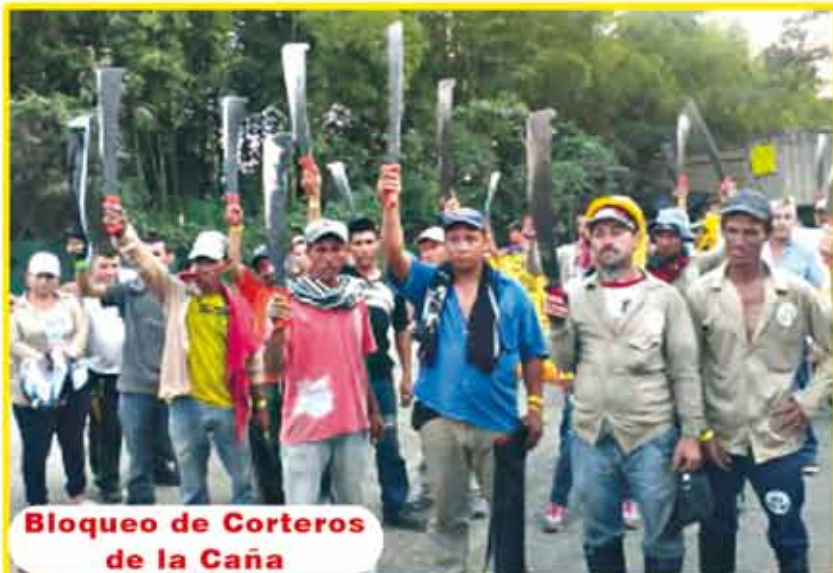
Bloqueo de Corteros de la Caña