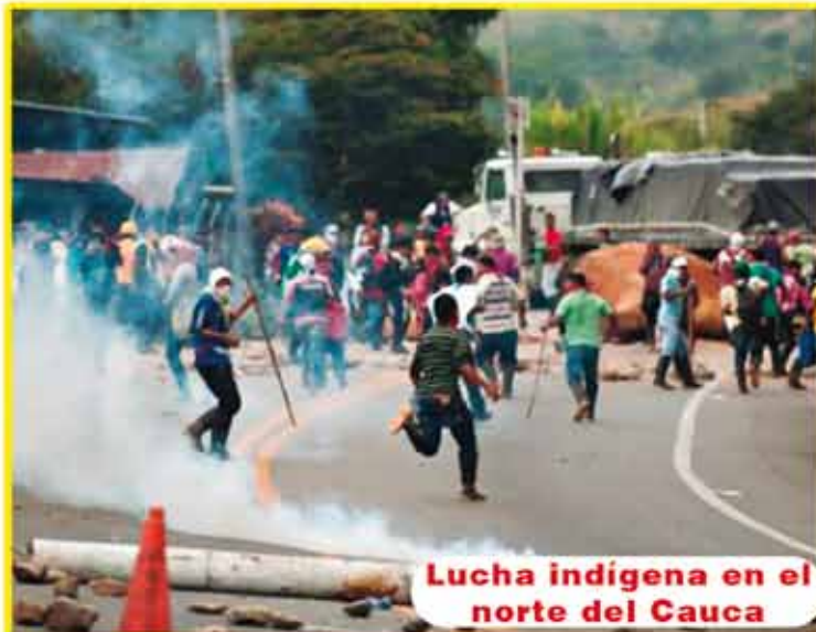
Lucha indígena en el norte del Cauca