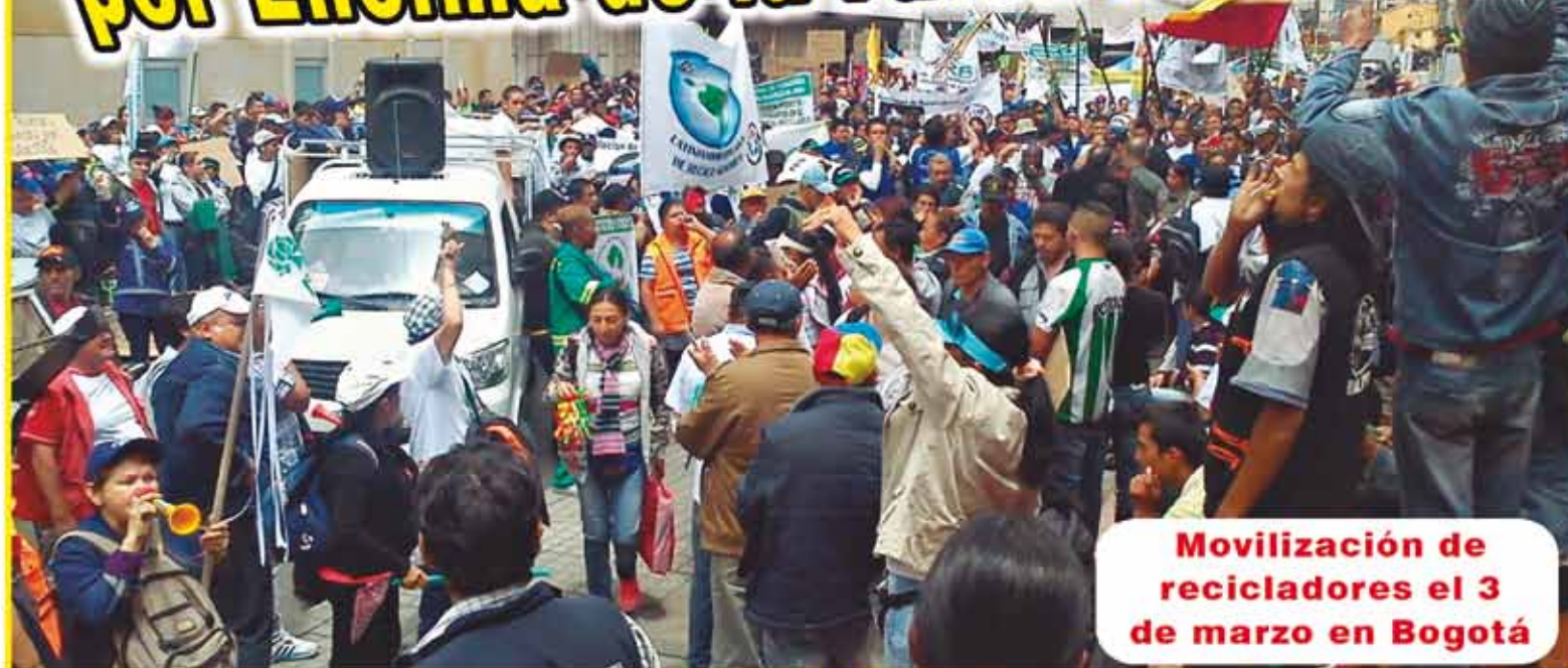
Mobilización de recicladores el 3 de marzo en Bogotá