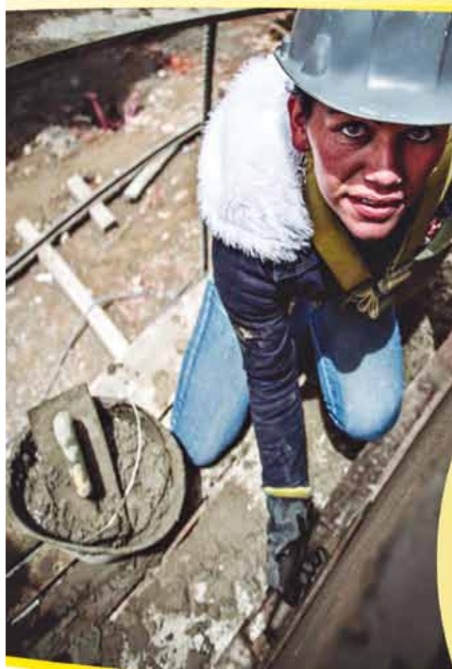
Obrera de la construcción en Zipaquirá - Colombia

¡La Emancipación de la Mujer Hace Parte de la Liberación del Proletariado!