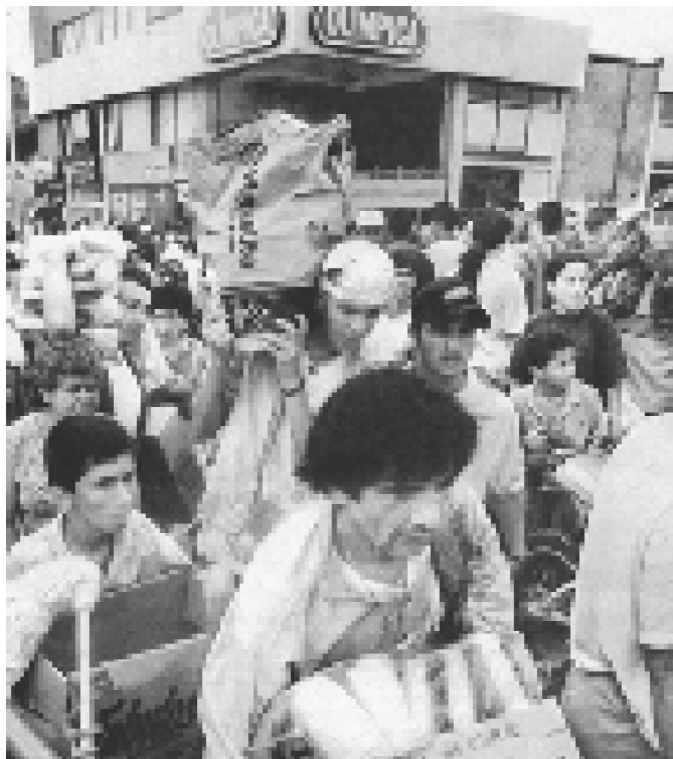
EXPROPIANDO A QUIENES TRAFICAN CON EL HAMBRE DEL PUEBLO

No podemos esperar a que el gran terremoto de la explotación capitalista nos aniquile por completo, es necesario aprender del camino que nos señalan los pobres de la zona cafetera, quienes valerosamente se han enfrentado con piedras a las fuerzas represivas, y en forma masiva han procedido a tomar por su propia mano la comida y el agua acumulados en los grandes supermercados capitalistas. Aprender de esta experiencia significa preparar la expropiación no de los supermercados de una ciudad, sino de toda la riqueza social usurpada por las clases dominantes y el imperialismo, quienes la cederán, sólo si derrotamos su poder político estatal, concentrando contra él toda la fuerza, toda la potencia, toda la lucha de las clases oprimidas y explotadas, hasta hacerlo saltar en pedazos. Significa que debemos superar la anarquía propia de la espontaneidad de los hechos, con la lucha organizada y bien preparada de todos los proletarios y campesinos pobres, bajo la dirección de un partido comunista revolucionario que nos conduzca a pisotear para siempre la maldita propiedad privada, cimiento y columna de este sistema capitalista oprobioso y hambreador. ✮