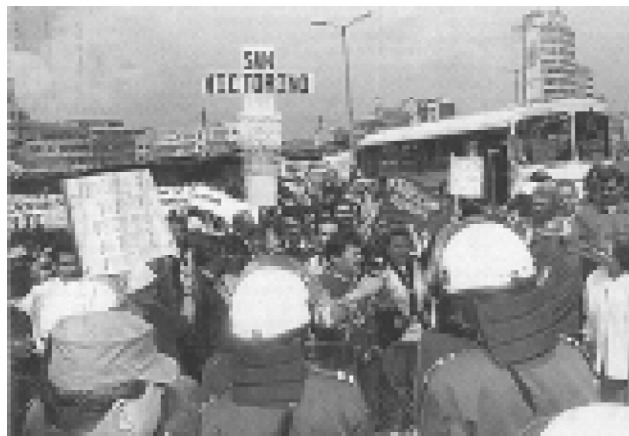
Desalojo de Vendedores Ambulantes en Bogotá

Esta denuncia sobre la situación de los compañeros vendedores ambulantes, está basada en algunos informes de nuestros lectores.