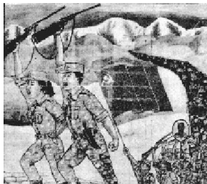
Afiche del Primer Aniversario de la Guerra Popular

han llevado a cabo con regularidad acciones de propaganda armadas, marchas y reuniones en la calle, etc.