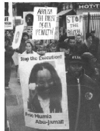
Una de las muchas protestas en favor de Mumia

Unimos nuestra voz, a la protesta masiva de los comunistas revolucionarios de EU, de las organizaciones de masas, de los círculos de intelectuales, de los activistas contra la pena de muerte, de los activistas contra el racismo y de todas las gentes sencillas que odian este sistema asesino, y que ahora luchan por no permitir que ejecuten a Mumia Abu-Jamal. ✊