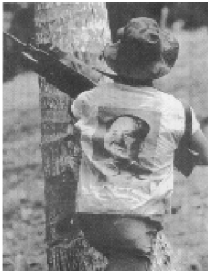
Combatiente del Nuevo Ejército Popular en Filipinas

Ante el colapso del Movimiento Comunista Internacional a raíz del golpe de Estado en China, dado por los revisionistas seguidores del camino capitalista en 1976 después de la muerte del dirigente y maestro del proletariado internacional, el camarada Mao Tse-tung, los oportunistas del Partido Comunista de las Filipinas sacaron la cabeza, cambiaron de línea y apoyaron a los traidores a la causa del proletariado en China: los golpistas encabezados por Jua Kuo-feng y Deng Xiao-ping. Por esa época el Partido Comunista de Filipinas había sufrido el golpe contundente de la detención del Presidente fundador del Partido, José María Sison y otros importantes líderes, siéndole más fácil a los enemigos de la revolución cambiar