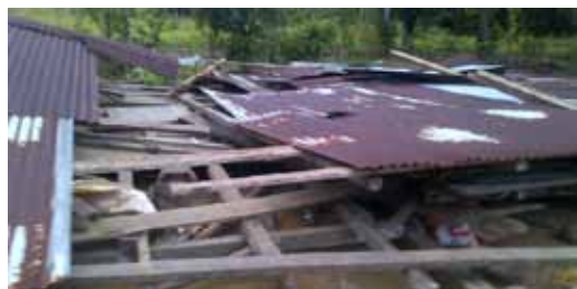
asi dejó la policía los ranchos de los desplazados

Una gran tragedia es la que están viviendo 90 campesinos desplazados en Turbo, Antioquia. Inició en 1996, en siete fincas de las veredas Guacamayas y La Eugenia de dicho municipio, cuando llegaron a amenazar traficantes de tierras escoltados con paramilitares armados hasta los dientes, diciendo a estas humildes familias “Me vende o le compro a la viuda”, por lo cual muchos se fueron por físico miedo.