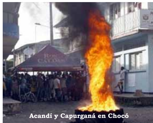
Acandí y Capurganá en Chocó

De otro lado, las demás manifestaciones del pueblo colombiano continúan siendo frecuentes y radicales, no logrando apaciguarlas, ni la dura represión de las fuerzas militares, ni el silencio de los medios de comunicación: