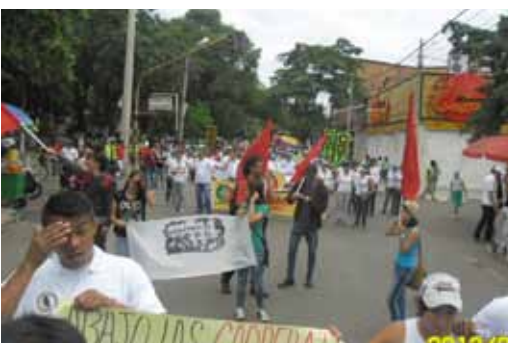
Manifestación en Cúcuta