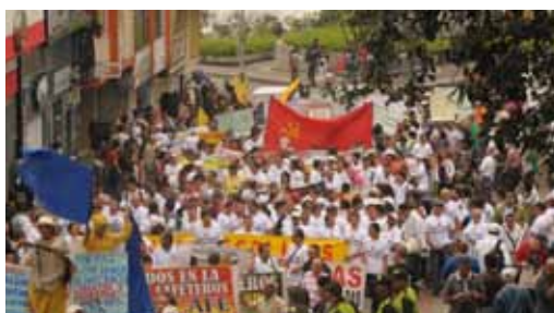
Manifestación en Manizales

Revolución Obrera denuncia la detención de varios manifestantes y los heridos por la bota policial.