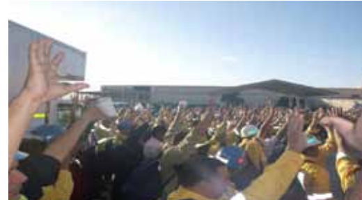
Obreros de Sintracarbón