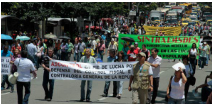
Marcha en Medellín el 7 de octubre

A las 9:39 de la mañana más o menos 300 personas realizaron una manifestación en el centro del municipio de Bello. La jornada fue convocada por el Comité de Usuarios de Servicios y el Comité de Defensa de la Educación; a ella se sumaron obreros de Fabricato, pensionados, maestros, estudiantes y pobladores. Las consi-