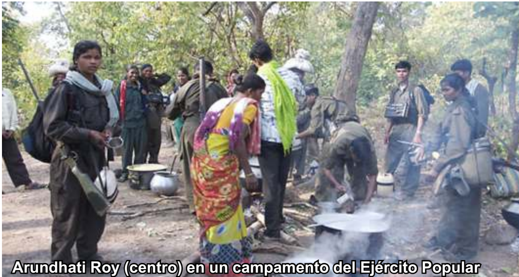
Arundhati Roy (centro) en un campamento del Ejército Popular

El pueblo de la India está pasando por duras pruebas; sobre todo en las regiones donde ha florecido la Guerra Popular, donde las masas bajo la dirección del Partido Comunista de la India (maoísta) han decidido tomar las riendas de la sociedad y dejar de ser bestias de carga de los ricos. Allí, un nuevo sol brilla y hoy esta nueva aurora está en peligro de ser destruida tras un baño de sangre de los reaccionarios. El mundo debe saber lo que sucede en la India. Los pueblos de los 5 continentes deben levantar sus voces de protesta contra la dantesca operación "Cacería Verde", y respaldar firmemente la valerosa guerra popular que se abre paso en medio de tantas dificultades.