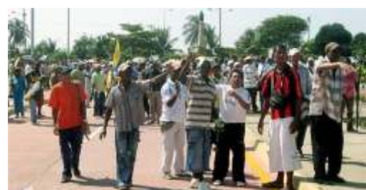
Protestas en las playas de Cartagena