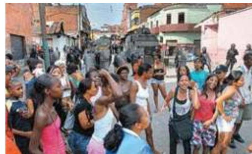
Levantamiento en el centro de Cali

Durante 8 horas las masas retuvieron al alcalde pugnando por hacerlo retroceder en su infame decisión de dejarlos sin el pan. Allí estuvieron hasta que los perros del ESMAD llegaron, quienes quedaron custodiando al tiranuelo “progresista”, para, según las declaraciones oficiales: “evitar cualquier situación o problema de orden público”.