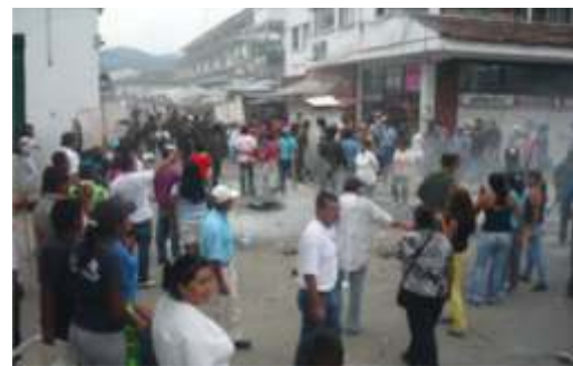
Combates en el centro de Popayán