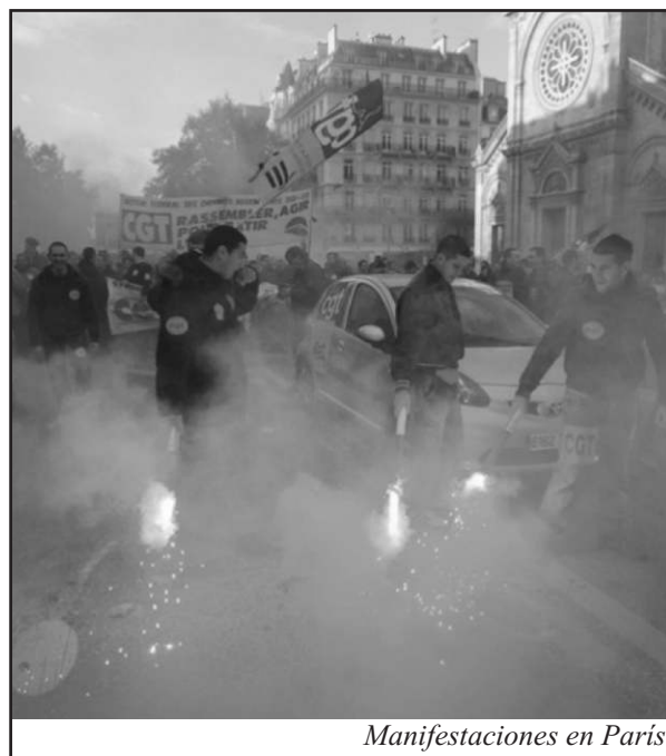
Manifestaciones en París

Francia y Alemania, dos puntales del centro de poder del imperialismo europeo, han sentido una pizca de lo que es la fuerza de la clase obrera, y con ello se remarca en letras de molde que esta clase es sin lugar a dudas la verdadera protagonista de la historia.