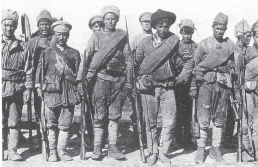
Un pelotón de soldados del Ejército Rojo bolchevique en Rusia - 1917

Ahora bien, cuál es la actitud que debe tomar cualquier obrero conciente o intelectual revolucionario. Romper la pasividad, actuar como lo que es: un hombre avanzado de la clase obrera que tiene la obligación de concretar su nivel de conciencia en lo organizativo. Nadie que se precie de tener algo de conciencia proletaria puede estar al margen de alguna forma organizativa, so pena de quedar reducido al nivel del obrero atrasado, o de peligrar en el camino hacia un simple charlatán. Para los obreros concientes y para los revolucionarios que han tomado la decisión de sumarse a las trincheras del proletariado, y dedicar sus esfuerzos al trasegar de la emancipación de toda la humanidad, este paso hacia la organización revolucionaria es la consecuencia lógica de su nivel de comprensión. Todos los unionistas organizados es la consigna que debe guiar la actividad de los cuadros y militantes e impulsar a los revolucionarios a dar el paso hacia su compromiso conciente con la lucha por la construcción del Partido Comunista Revolucionario en Colombia.