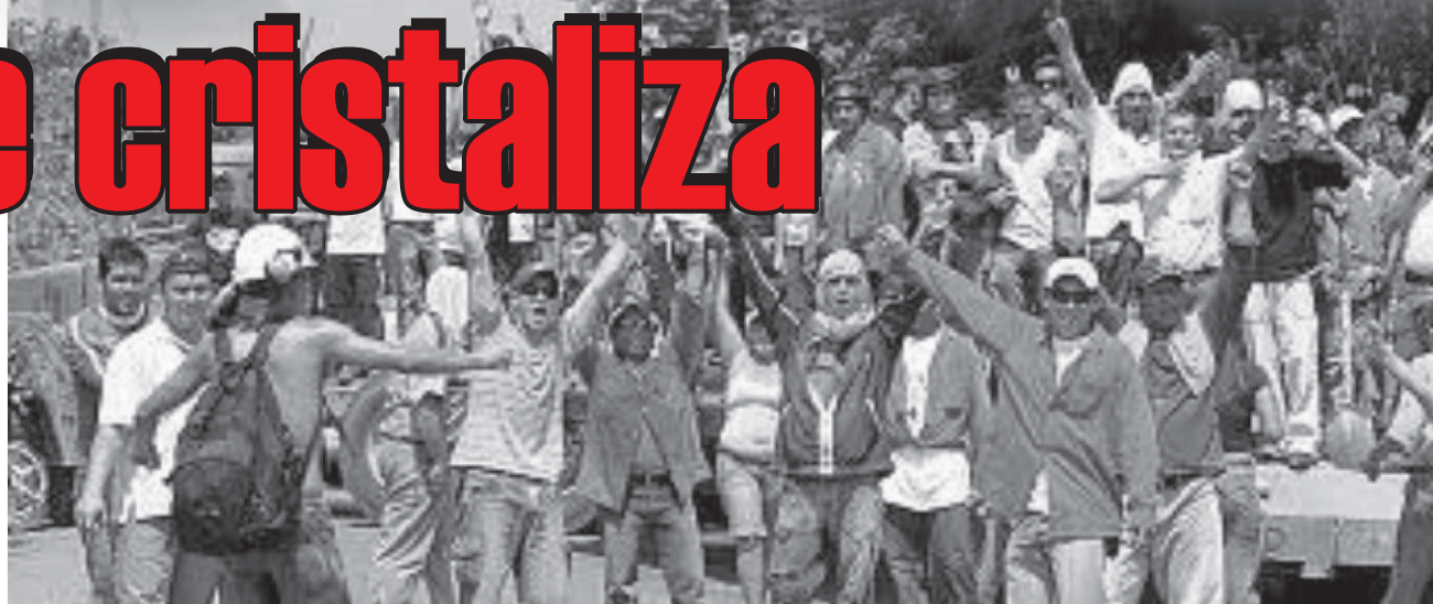
Manifestaciones y enfretamientos en Barranca