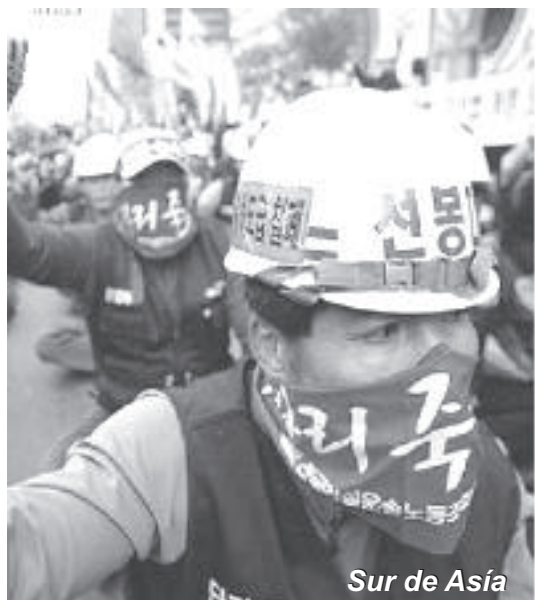
Sur de Asia

Egipto. Los trabajadores egipcios recordaron desde antes del primero de mayo, las falsas promesas electorales del gobierno de mejorar sus condiciones y en una continuación de las protestas masivas que protagonizaron en febrero para exigir la mejora de su situación, realizaron varias movilizaciones durante varios días anteriores al Primero de Mayo. De destacar como muy significativo, el hecho de que más de 4.000 trabajadores del sector textil se declararon en huelga de hambre y salieron a las calles en el Delta del Nilo para pedir mejoras económicas y sociales. Los huelguistas, una parte de los miles de asalariados de los sectores del textil, alimentario y de la construcción, protagonizaron una larga semana de protestas en varias localidades del norte del país. Entre las exigencias de los manifestantes figuraban el aumento de los sueldos, el pago de beneficios de las empresas y una mejor asistencia en salud. La ola de protestas fue descrita como la más grande desde la llegada del presidente egipcio, Hosni Mubarak al poder, hace 26 años, especialmente porque procedió del sector textil, que representa una de las principales fuentes de ingresos del país.