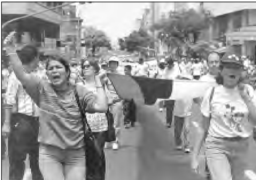
Los educadores del Valle se movilizan en contra de las políticas del gobierno