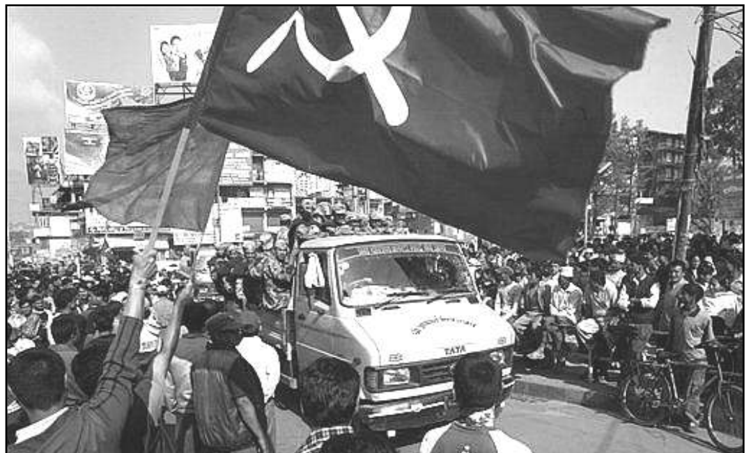
2 de junio. Las masas ávidas de revolución se toman las calles en Katmandú

Al referirse al desarrollo de la ciencia, también se han resbalando gravemente al argumentar que el marxismo se quedó