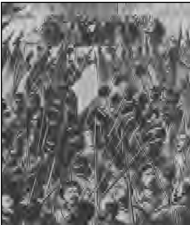
Solemne proclamación de la Comuna de París en la plaza del Hotel de Ville.