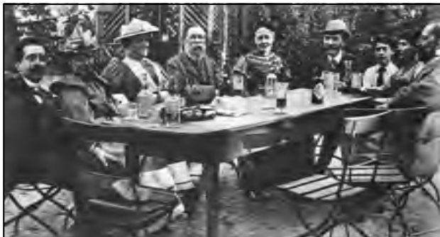
Federico Engels, August Bebel, Clara Zetkin y otros en Zurich, durante el Congreso obrero socialista internacional. Agosto de 1893.

Es este un segundo aire que no le durará mucho al imperialismo, pues la propia realidad del oriente europeo y de la Rusia capitalista, muy rápido ha demostrado que no es capitalismo lo