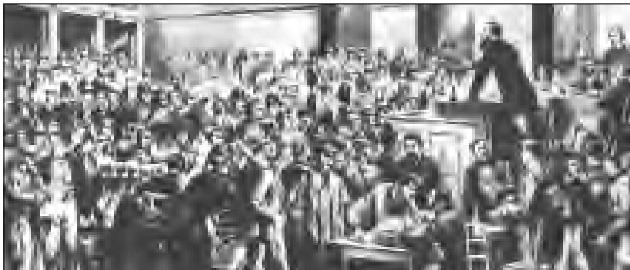
Asamblea de la Unión de asociaciones obreras alemanas 1868