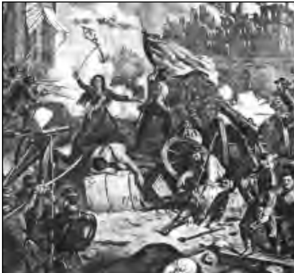
Heroico combate de la Comuna de París

Si el proletariado no logra derrotar los programas de otras clases el camino del reformismo se abrirá paso y desviará la lucha de las masas, y por consiguiente, aplazará por quien sabe cuantos años la construcción del partido y el triunfo de la revolución.