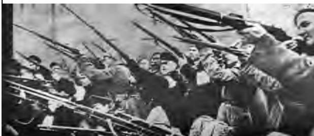
En Petrogrado, tropas rebeldes del zar voltean sus fusiles y se unen a la insurrección de los obreros - una insurrección que culminó en la toma del poder por la clase obrera por primera vez en la historia.