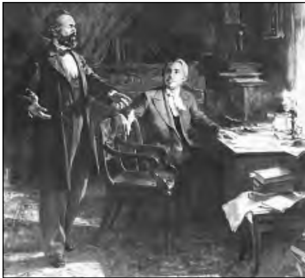
Carlos Marx y Federico Engels