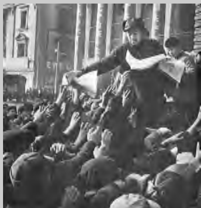
Los ciudadanos de Shanghai reciben con júbilo mensajes y saludos del partido y la dirección estatal