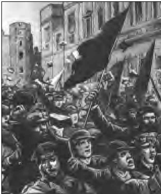
Manifestación de desocupados en Londres en 1886