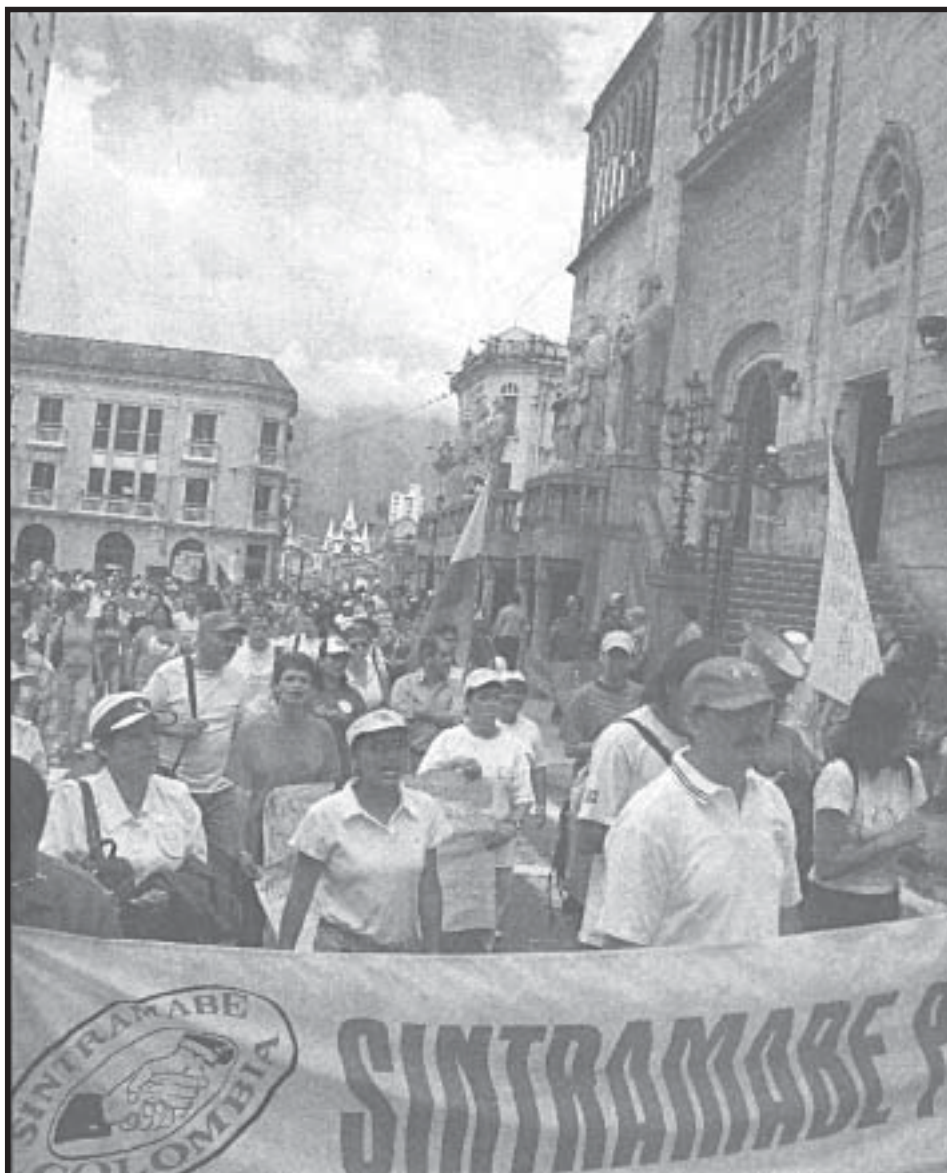
Los obreros industriales marchan al frente en la manifestación del 18 de agosto en Manizales

Hoy el movimiento de masas ha entrado en un nuevo período, se ha ido despojando de la confianza en los politiqueros, ha ido ganando independencia y confianza en su propia lucha y movilización, y por tanto, también exige una nueva forma de organización para la lucha de masas, independiente, sin politiqueros. Esta nueva forma debe ser del tipo de las Asambleas Populares que designen organismos de dirección con representantes de las masas y no con politiqueros; los Comités de Lucha que agrupen a los más destacados luchadores; los Encuentros Obrero-Campesinos que elijan Comandos Obreros Campesinos para la dirección del movimiento.