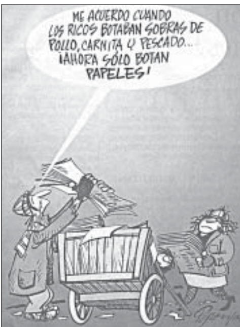
Tomada de El Tiempo 22-08-04