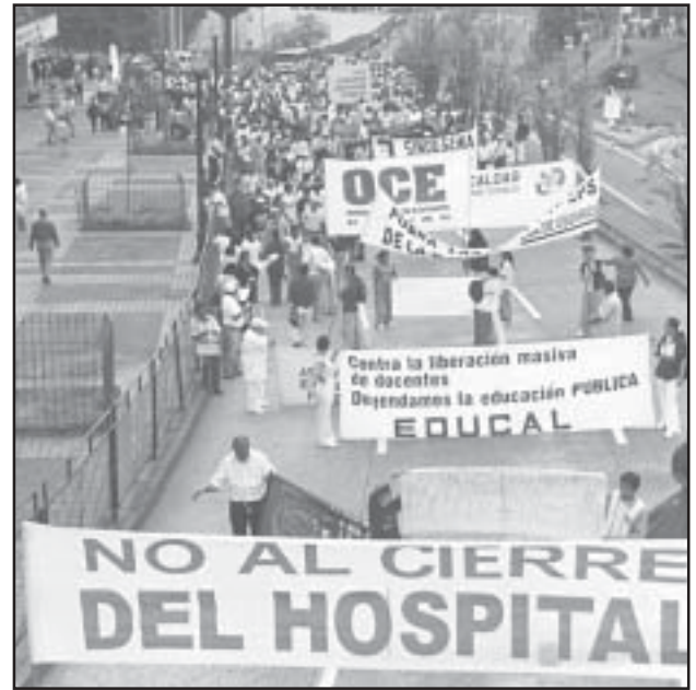
Aspecto de la manifestación del 18 de agosto en el centro de Manizales

Cuarenta vendedores ambulantes de la Galería, taponaron al medio día la Avenida del Centro y luego se unieron a la manifestación. Las Madres Comunitarias bloquearon la Calle 23, arteria peatonal y vehicular de Manizales. Las diversas manifestaciones que se hicieron desde los puntos de bloqueo hacia el centro de la ciudad, a lo largo de su recorrido