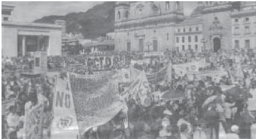
Manifestación realizada el 16 de septiembre en Bogotá contra las medidas reaccionarias del jefe paramilitar Uribe Vélez

Los "amigos del pueblo" se oponen al gobierno de Uribe Vélez pero también se oponen a que la lucha del pueblo se convierta en una lucha revolucionaria; esto es, están de acuerdo en luchar contra el jefe paramilitar pero se oponen a la lucha revolucionaria de la clase obrera y el campesinado por el socialismo. Buscan "humanizar" la explotación asalariada y por eso no van más allá de la defensa del "estado social de derecho", es decir, la defensa de la democracia burguesa, la defensa de la explotación asalariada, la defensa de la propiedad privada burguesa, causantes de todos los males que aquejan la sociedad colombiana. Por eso toda lucha dirigida por ellos termina en las mesas de traición, de concertación y conciliación con los enemigos irreconciliables del pueblo. Esto quiere decir que la clase obrera y el campesinado deben comprender que sus aspiraciones sólo pueden alcanzarse con la unidad consciente y por la base, con la organización y la lucha revolucionaria que enseñe a las masas, que las entrene y las prepare en nuevas y superiores formas de organización y de lucha, que las acerque a la confrontación definitiva por la destrucción de las relaciones sociales vigentes, empezando por la destrucción del Estado que garantiza, por la fuerza de las armas, los privilegios de las clases parásitas que viven a expensas de la explotación asalariada.