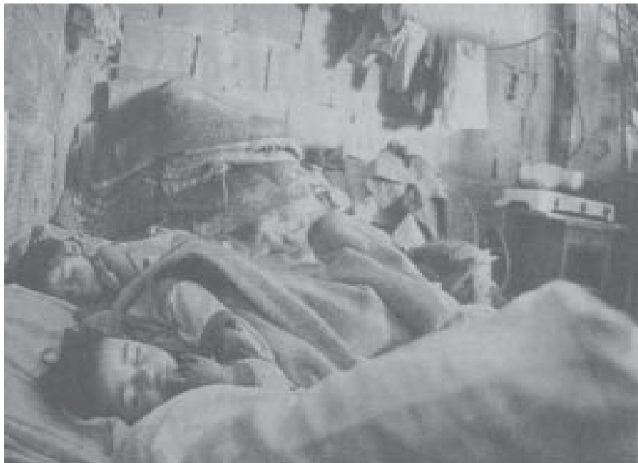
Desplazados, víctimas de la guerra reaccionaria hacinados en uno de los miles de tugurios de la capital

Los hechos del Atrato y de los desplazados desalojados de las instalaciones de la Cruz Roja Internacional, nos muestran que tenemos la razón