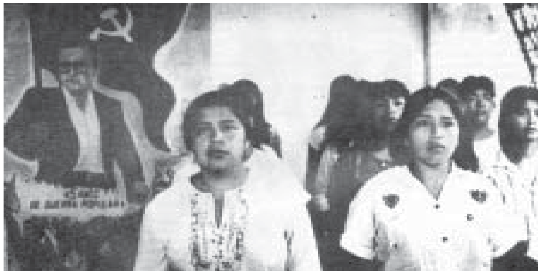
Presas revolucionarias del Penal de Canto Grande (1991)

El Boletín de Emergencia #61 del CIE contiene un informe sobre lo que dice el gobierno sobre la huelga de hambre en El Callao: "No podemos aceptar como válido nada que provenga del estado peruano. El CIE ha puesto de manifiesto una y otra vez que el estado peruano tiene una larga historia de tergiversar los hechos y, como tal, no puede dárseles de fuente confiable de información respecto al Dr. Guzmán y los otros presos. Las autoridades tienen que dejar de actuar como voceros del Dr. Guzmán. Mientras continúe el aislamiento del Dr. Guzmán, las autoridades saben bien que sus declaraciones y alegatos no son verificables en absoluto. Sin embargo, estas aseveraciones destacan claramente la urgencia de poner fin al aislamiento del Dr. Guzmán, en especial con relación a la salud del Dr. Guzmán".