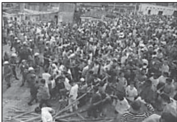
Los habitantes de Nuevo Horizonte que en 1998 lograron conseguir vivienda ahora están siendo asesinados.

¡Viva la Movilización Revolucionaria de las Masas!