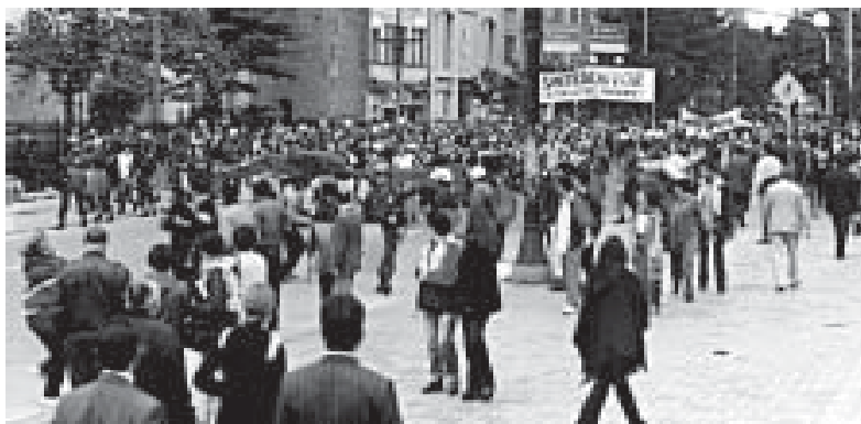
Multitudinaria marcha por la Carrera 7 en la ciudad de Bogotá

Y que mejor ocasión que el Primero de Mayo, día internacional de la clase obrera para preparar esta gran huelga, movilizándonos todos en contra de la conciliación y la división. El Primero de Mayo debe ser un día de lucha revolucionaria preparatorio de la Huelga Política de Masas, donde tomemos conciencia del poder que tiene nuestra unidad y lucha organizada, no sólo para frenar la arremetida criminal de las clases dominantes y el imperialismo, sino también para barrer de la faz de la tierra su podrido sistema. Tal y como agitaban los obreros del hospital San Juan de Dios: "El presente es de lucha, el futuro socialista". ↯