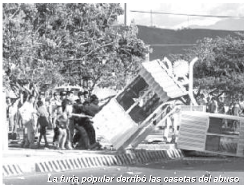
La furia popular derribó las casetas del abuso

Con miras a que las masas se preparen mejor para los enfrentamientos contra el ESMAD, desde las páginas de la prensa de los explotados y oprimidos llamamos a los lectores a que nos envíen informes sobre sus experiencias, las formas y los métodos adoptados en tales enfrentamientos, los errores que hay por corregir, los aciertos que hay que generalizar, a fin de poner a disposición de las masas luchadoras este conocimiento.