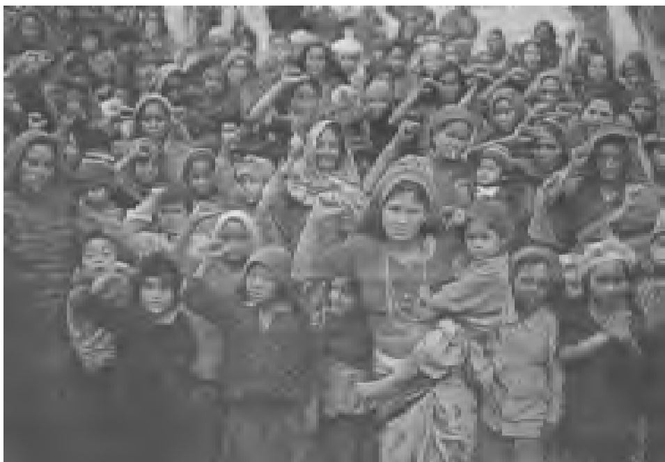
La Mujer revolucionaria de Nepal, un ejemplo en la lucha por acabar con todo tipo de opresión.

En cambio el proletariado y los comunistas llamamos a celebrar el 8 de Marzo como el día de la Mujer oprimida y explotada que necesita liberarse, como un día de lucha y de concientización sobre su papel como protagonista en la lucha para conquistar su verdadera y real liberación. Desde 1910 un Congreso Internacional de Mujeres declaró el 8 de Marzo como un día de lucha a nivel internacional; en primer lugar, para conmemorar el heroico sacrificio de las obreras huelguistas incineradas en 1908 por los capitalistas en la fábrica Cotton de Nueva York; y en segundo lugar, para hacer de esta celebración un motivo de conciencia entre hombres y Mujeres proletarias sobre la verdadera situación de la Mujer en la sociedad de clases, sobre las causas de esa situación y sobre el gran e importante papel que deben jugar las Mujeres trabajadoras, las Mujeres revolucionarias, las Mujeres comunistas en la conquista de su emancipación.