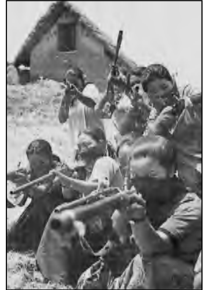
Mujeres Milicianas de Rolpa, Nepal.

Actualmente existe la Asociación Nacional de Mujeres Nepalesas (revolucionaria) que acoge la línea del partido de que la opresión de la mujer tiene su base en el feudalismo y de que desarrollar la guerra popular contribuye indiscutible-