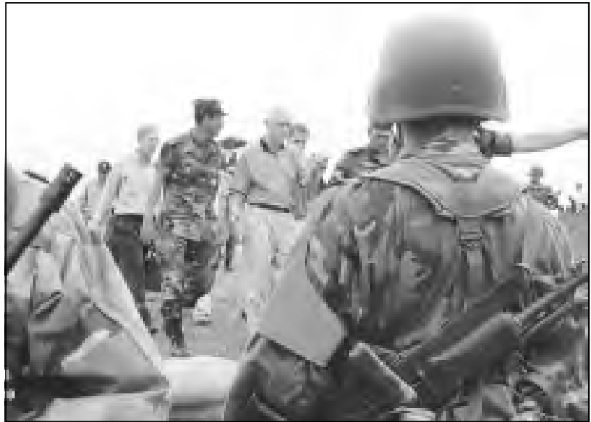
Base Tres esquinas - Colombia. Barry Mc Caffrey da ordenes a las FFAA lacayas del imperialismo.

A la pequeña burguesía se le olvida con una facilidad asombrosa el carácter del Estado colombiano y la experiencia de los cientos y millares de muertos después de cada entrega; y lo más terrible, es su creencia absurda de que en la sociedad de clases pueden existir unas fuerzas militares por encima de los intereses de las clases, se olvidan que “el poder nace del fusil” y mientras los fusiles se encuentren del lado de la burguesía y los terratenientes representados en su Estado, estarán sirviendo exclusivamente a sus intereses en contra de los intereses del pueblo y como fuerzas directas de la opresión y el sometimiento violento de las masas para garantizar la explotación.