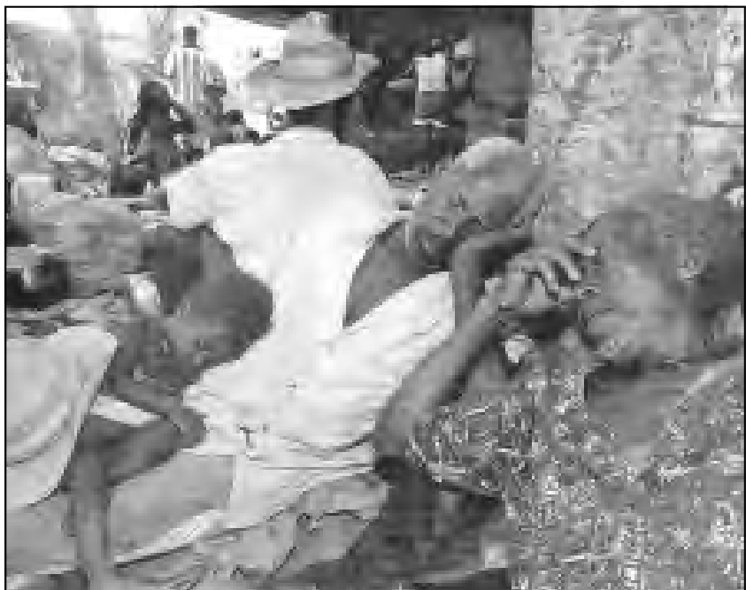
Masacrar, arruinar y expulsar al campesino pobre: una condición para la paz entre nuestros enemigos