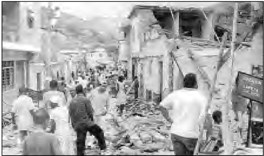
Suárez, después del ataque guerrillero. Las masas trabajadoras indefensas víctimas del fuego cruzado.

En otras palabras, las negociaciones de paz son: guerra económica contra el proletariado y los desposeídos, migajas para la pequeña burguesía y superganancias para el capital monopolista.