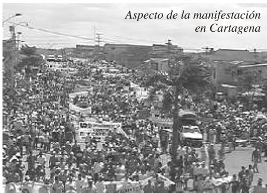
Aspecto de la manifestación en Cartagena

El oportunismo empotrado en los cascarrones de las centrales y apiñado en la Gran Coalición Democrática, admite abiertamente el crecimiento de la inconformidad y la rebeldía de las masas y se propone como viene haciéndolo desde hace varios años, ponerse al frente para