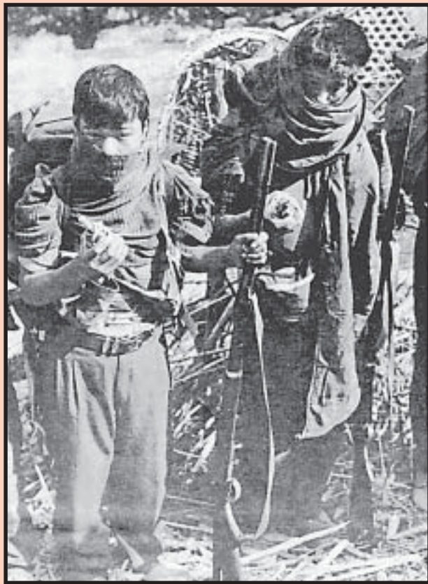
8 Años de Guerra Popular en Nepal