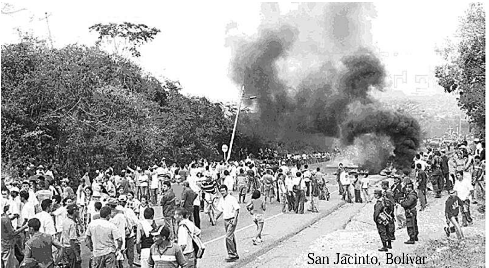
San Jacinto, Bolívar

Aprovechando las debilidades del régimen para luchar 5