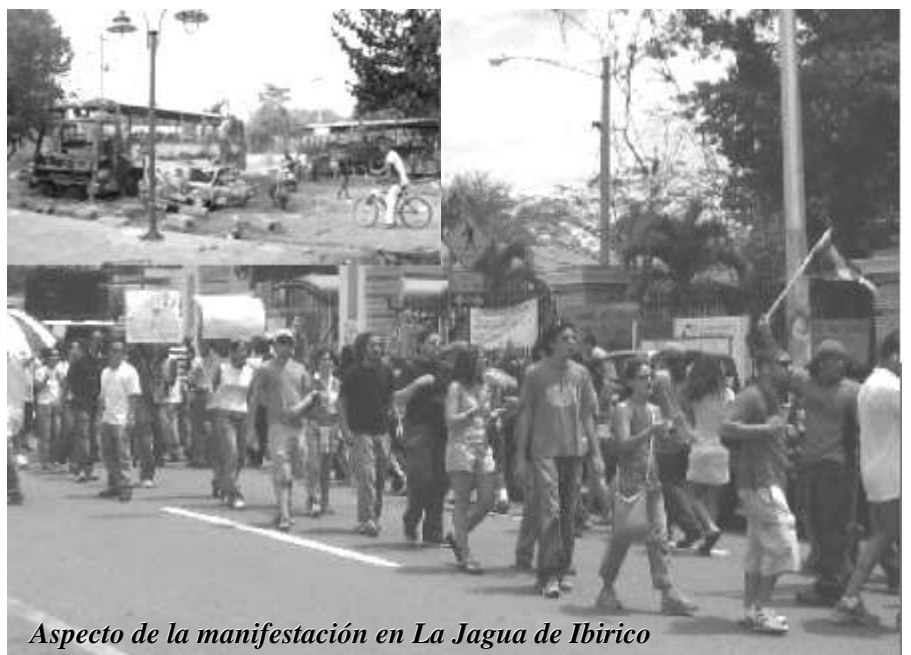
Aspecto de la manifestación en La Jagua de Ibirico

Cuando el pueblo se levanta es la voz de las masas la que manda, y esa verdad cuando se hace manifiesta hace temblar a todos los enemigos de la revolución.