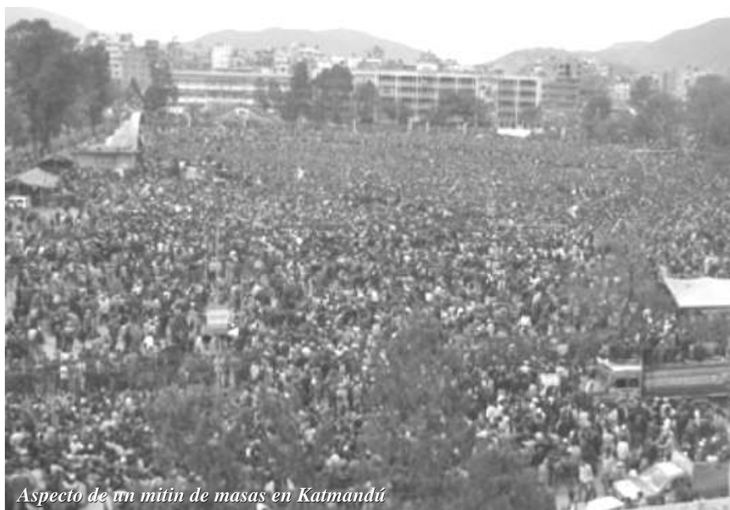
Aspecto de un mitin de masas en Katmandú

Nuestra posición es clara, el prachandismo es la claudicación y la renuncia; nuestros vivos son para la Guerra Popular y por la revolución. Y hoy en su once aniversario, con firmeza levantamos la roja bandera de la revolución proletaria, la bandera que enarbolan Marx, Engels, Lenin, Stalin y Mao Tse Tung, la bandera que ha ondeado durante estos once años en las elevadas cumbres himalayas, y por las que el pueblo de Nepal ha ofrendado miles de vidas. En este once aniversario, los pueblos del mundo deben saber, que a pesar de los reveses y la traición de los prachandistas, la lucha continúa, y de entre las fuerzas honestas de Nepal y el mundo, saldrá la nueva vanguardia que pondrá en su lugar a los traidores y continuará en su camino hacia la revolución.