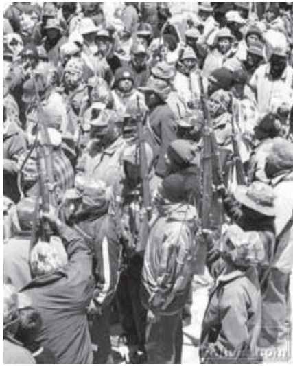
¿Midiendo fuerzas? Armarse no es secreto

Lo que se vive hoy en Bolivia es por su contenido, el preludio de un gran levantamiento popular contra un Estado reaccionario que ha accorralado en la miseria, el hambre y el terror de sus fuerzas militares a todo el pueblo. Al cierre de esta edición La Paz se encuentra sitiada, ha aumentado el número de muertos y heridos, hay amenazas de golpe de Estado, algunos sectores de la policía no quieren obedecer las órdenes y los campesinos empiezan a armarse para resistir a las balas del ejército. Y en medio de esta situación se siente la ausencia de un Partido Comunista Revolucionario que sea capaz de dirigir al pueblo hacia donde realmente tiende: a la revolución política y social. Las condiciones están maduras, y en Bolivia, como en Colombia, la pugna por la dirección de las masas es definitiva; el oportunismo se apresta a entregar por migajas la combatividad del pueblo y si no lo ha hecho, es gracias a la presión de las masas, a su exigencia de soluciones de fondo y a que en los hechos se ha impuesto la movilización revolucionaria de las masas. ♪