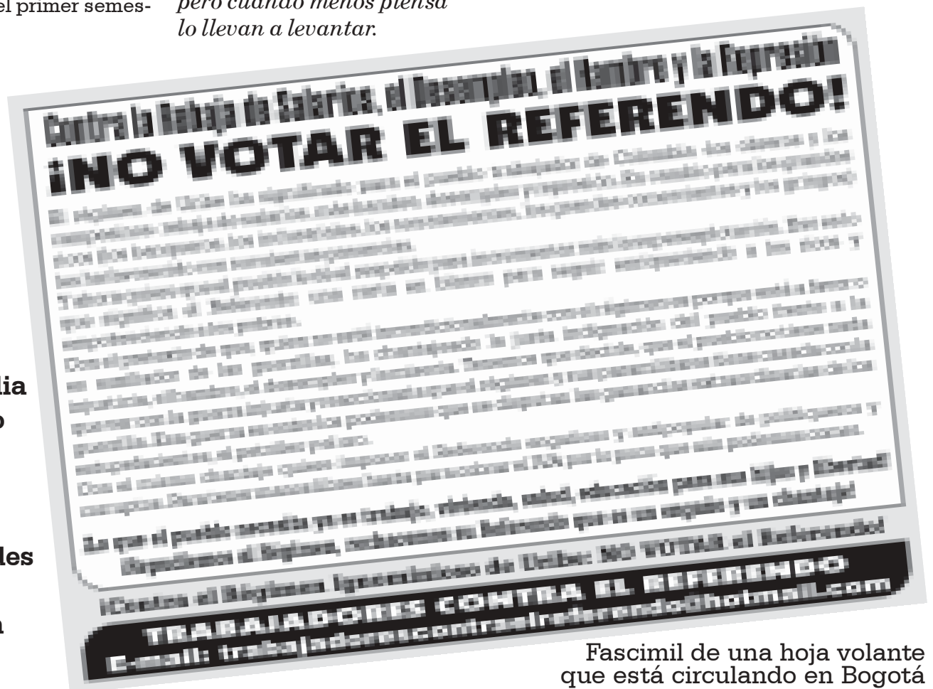
Fascimil de una hoja volante que está circulando en Bogotá

Usted compañero, que también odia este régimen, lo invitamos a vincularse a los Comités en las distintas ciudades y participar activamente en esta batalla.