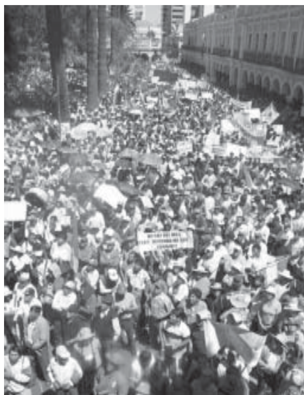
Gigantesca Manifestación en La Paz

Bolivia es un volcán en erupción, al igual que otros países, entre ellos Colombia, lo que se evidencia es la disposición de las masas para enfrentar el capitalismo en la