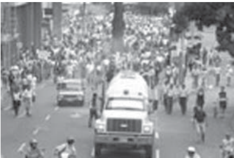
Cali. Multitudinaria Manifestación del 22 de septiembre

En un verdadero contrapunteo se ha convertido el conflicto de Emcali, el cual solamente en diez días ha tenido enfrentada a la burguesía con las masas, quienes se volcaron a las calles para impedir la liquidación de la empresa; un campo de batalla en el cual, de un lado, se encuentra el Estado repleto de contradicciones como reflejo de las posiciones de varios sectores que pujan por privatizarla en lo inmediato pase lo que pase y, quienes han reulado y buscan otras alternativas; del otro, se encuentran los trabajadores, estudiantes y usuarios, es decir, las masas laboriosas de Cali que no se resignan a que liquiden la Empresa.