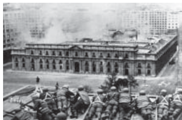
11 de septiembre 1973. La Casa de la Moneda minutos antes de ser bombardeada.

“La esencia de este nuevo tipo de Estado [Dictadura del Proletariado] consiste en que la fuente del poder está en la iniciativa directa de las masas desde abajo; en la sustitución de la policía y el ejército -instituciones apartadas de las masas y contrapuestas a ellas-, por el armamento general del pueblo; en la sustitución de la burocracia por funcionarios elegidos y removibles por las masas, y remunerados con salarios de obrero. Es un aparato de dominación sobre los explotadores, ejercida por el pueblo en armas, cuya base organizada la constituyen las milicias obreras y campesinas, y el ejército de obreros y campesinos. Pero la esencia de la dictadura del proletariado no reside sólo en la violencia, ni principalmente en la violencia. Su esencia fundamental reside en la organización y disciplina del destacamento avanzado de los trabajadores, de su vanguardia, de su único dirigente: el proletariado”