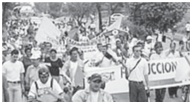
Manifestación en Barranca el 12 de agosto de 2003

Por eso criticamos también a los compañeros que renunciaron a sus cargos, pues todos han conducido a las masas al acabose de su organización, a la entrega de la convención colectiva de trabajo, porque se han creído la basura burguesa de que el Estado explotador y opresor de los reaccionarios, puede ser neutral y favorecer a los trabajadores, sus enemigos.