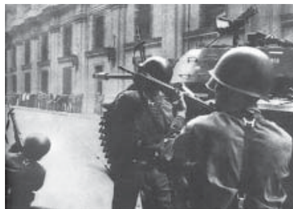
11 de septiembre 1973. Las calles amanecieron tomadas por la bota militar.