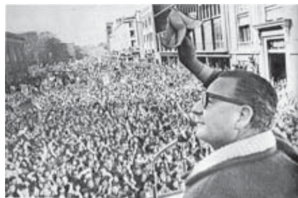
Salvador Allende en un discurso desde el balcón del palacio presidencial.

Dice el dicho popular que “al perro no lo capan dos veces”, pero la sabiduría del pueblo parece estrellarse contra el cretinismo y la terquedad pequeñoburguesa que se niega a aprender las lecciones y que insiste en pretender hacer cambios o “revoluciones” al orden burgués imperialista sin destruir el Estado que le sirve de sustento.✂