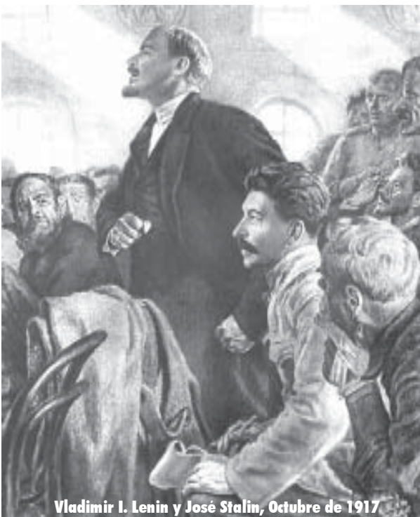
Vladimir I. Lenin y José Stalin, Octubre de 1917

En Rusia la situación con respecto al problema nacional era en extremo complicada, pues la autocracia zarista simbolizaba la subyugación nacional, el dominio de la nación rusa sobre las demás naciones (entendiendo por nación en palabras de Stalin, "una comunidad humana estable, históricamente formada y surgida sobre la base de la comunidad de idioma, de territorio, de vida económica y de psicología, manifestada ésta en la comunidad de cultura"). Rusia era un gran estado multinacional, compuesto por la nación fuerte, dominante y una serie de naciones débiles y subordinadas; y esa herencia terrible de la desunión de las distintas clases obreras de las distintas naciones oprimidas, fue endosada al nuevo Estado del proletariado, cuyo partido, antes del surgimiento del imperialismo, planteaba el problema nacional en su programa, como el reconocimiento del derecho de las naciones a la autodeterminación , a condición de que la independencia nacional, se supeditara a los intereses de la lucha de clase del proletariado.