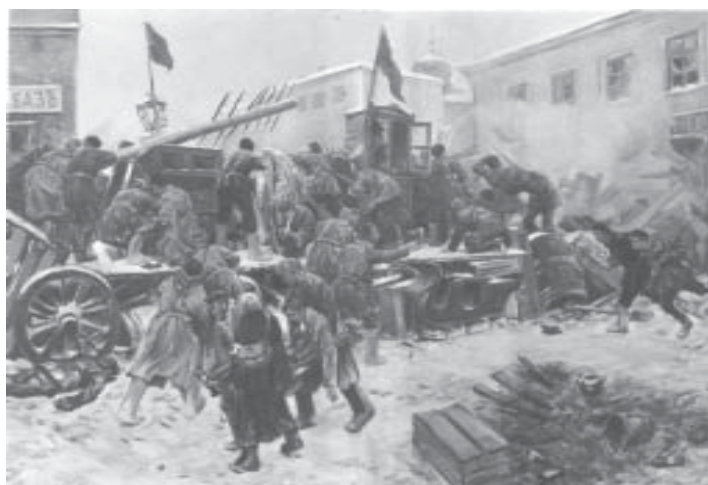
En las barricadas de 1905. (Cuadro de I. Vladímirov)

Durante todo este período revolucionario y los años de contrarrevolución, José Stalin desarrolla una tenaz actividad práctica de agitación, propaganda y organización, siempre en defensa del marxismo, siempre como ejemplar bolchevique, siempre como enemigo irreconciliable con el oportunismo. Parte de su tiempo lo dedicaba a traducir al