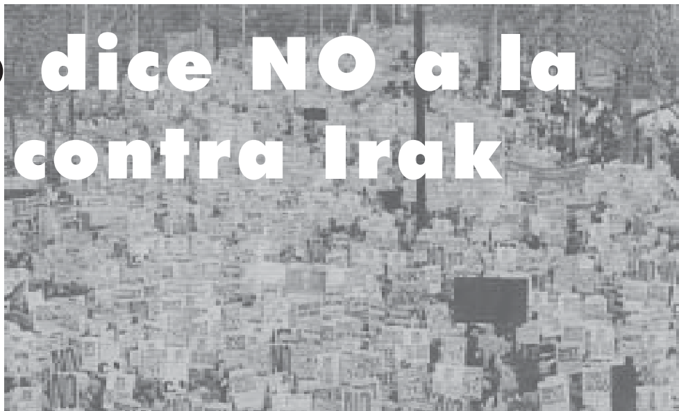
Manifestaciones en Londres contra un posible ataque de Inglaterra y Estados

Obrero Revolucionario #1188, 23 de febrero, 2003, posted at rwor.org