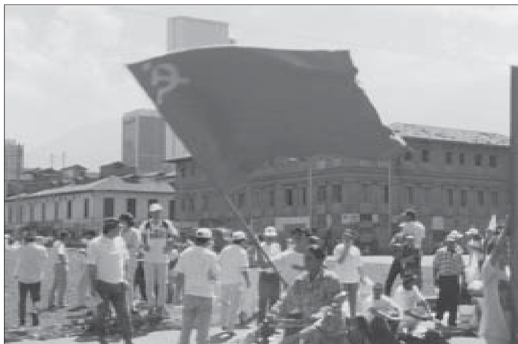
Manifestación en Medellín