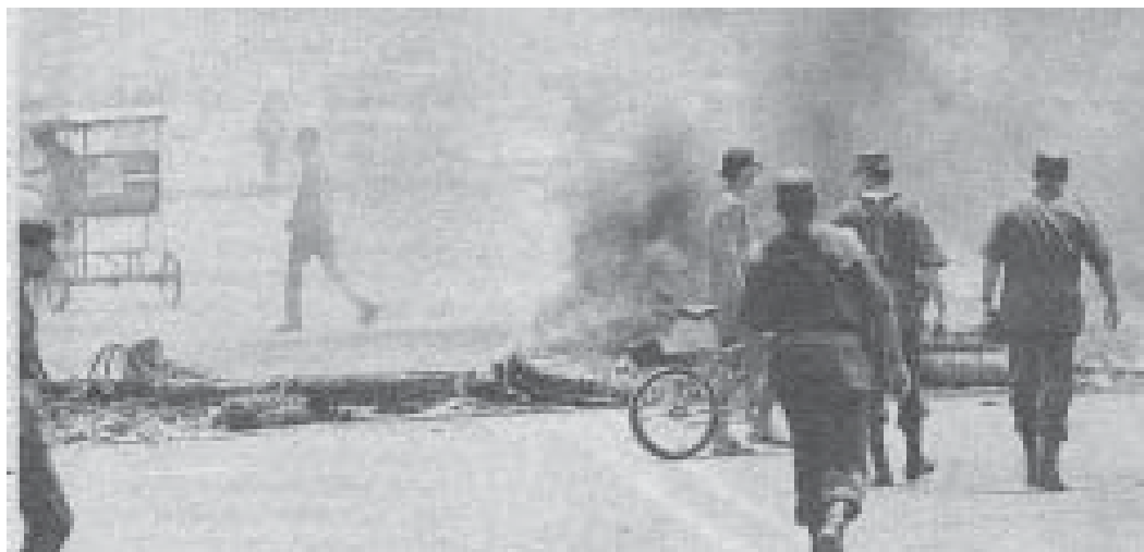
Las masas desafiaron con firmeza la represión de las fuerzas armadas en sendos combates callejeros