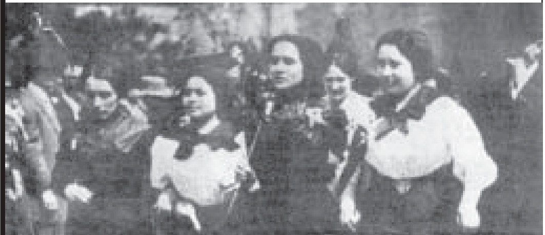
Costureras durante el levantamiento de las 20.000 mujeres en 1909