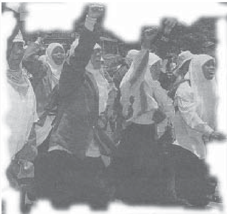
Mujeres de Indonesia protestan contra la intervención yanqui a Afganistán

Por: Bob Avakian, presidente del PCR,EU Obrero Revolucionario #1124