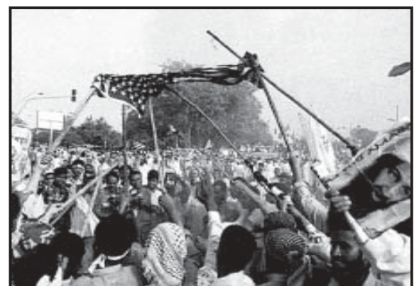
Afganos quemando bandera estadounidense

Partido Comunista Revolucionario, EU Septiembre 14, 2001