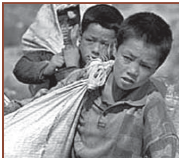
Niños refugiados afganos