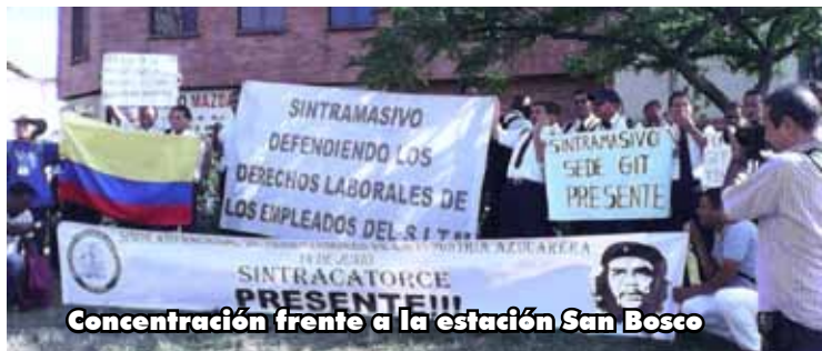
Concentración frente a la estación San Bosco