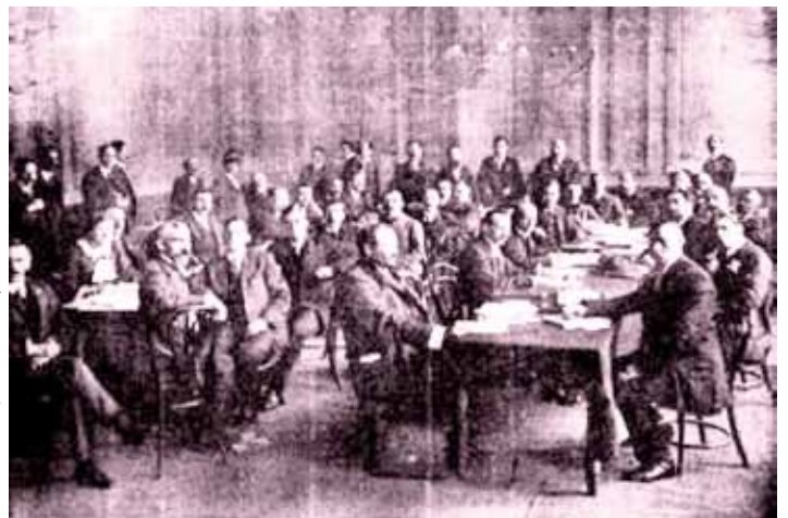
Congresistas de la II Internacional. 1913

La bancarrota de la segunda internacional fue sólo pasajera, ya que sólo 5 años después, en 1919, V. I. Lenin, maestro del proletariado internacional, encabezaría con su partido bolchevique, la fundación la Internacional Comunista o Tercera Internacional, que lideraría la lucha mundial de los explotados y oprimidos hasta 1943, obteniendo magníficas y numerosas victorias que repercutieron en todo el mundo. Desde aquel tiempo, la causa de los comunistas y proletarios del mundo no ha contado con su organización internacional, dispositivo estratégico para sepultar de una vez y por todas al imperialismo de la faz del globo, convirtiéndose hoy en la tarea primordial a nivel internacional de los comunistas revolucionarios, y quienes pese a sus derrotas pasajeras, siguen marchando hacia la conformación de una nueva Internacional.