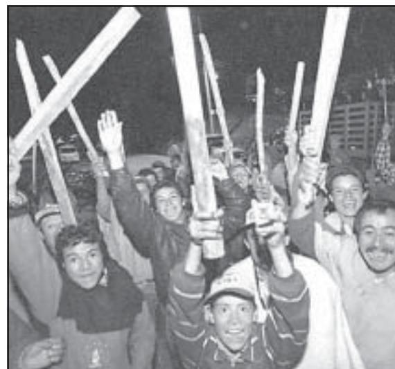
Con el Estado y sus gendarmes la pelea es peleando