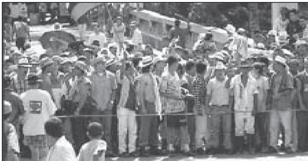
Miles de trabajadores en el campo, reencontrándose con el camino de la lucha