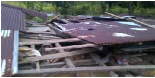
asi dejó la policía los ranchos de los desplazados

Una gran tragedia es la que están viviendo 90 campesinos desplazados en Turbo, Antioquia. Inició en 1996, en siete fincas de las veredas Guacamayas y La Eugenia de dicho municipio, cuando llegaron a amenazar traficantes de tierras escoltados con paramilitares armados hasta los dientes, diciendo a estas humildes familias “Me vende o le compro a la viuda”, por lo cual muchos se fueron por físico miedo.