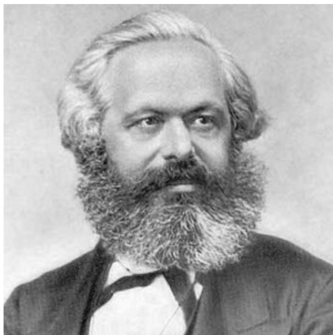
(Tréveris, 5 de mayo de 1818 - Londres, 14 de marzo de 1883)

Dos descubrimientos como éstos debían bastar para una vida. Quien tenga la suerte de hacer tan sólo un descubrimiento así, ya puede considerarse feliz. Pero no hubo un sólo campo que Marx no sometiese a investigación -y éstos campos fueron muchos, y no se limitó a tocar de pasada ni uno sólo- incluyendo las matemáticas, en la que no hiciese descubrimientos originales. Tal era el hombre de ciencia. Pero esto no era, ni con mucho, la mitad del hombre. Para Marx, la ciencia era una fuerza histórica motriz, una fuerza revolucionaria. Por puro que fuese el gozo que pudiera depararle un nuevo descubrimiento hecho en cualquier ciencia teórica y cuya aplicación práctica tal vez no podía perverse en modo alguno, era muy otro el goce que experimentaba cuando se trataba de un descubrimiento que ejercía inmediatamente una influencia revolucionadora en la industria y en el desarrollo histórico en general. Por eso seguía al detalle la marcha de los descubrimientos realizados en el