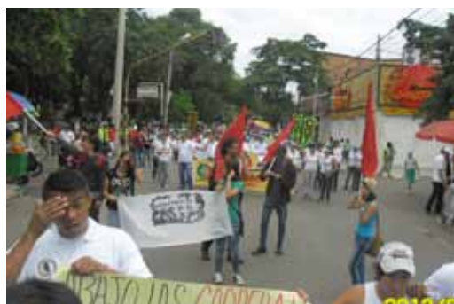
Manifestación en Cúcuta