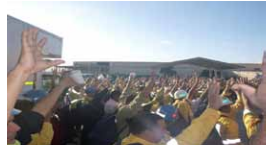
Obreros de Sintracarbón