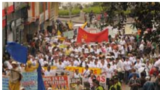
Manifestación en Manizales

Revolución Obrera denuncia la detención de varios manifestantes y los heridos por la bota policial.