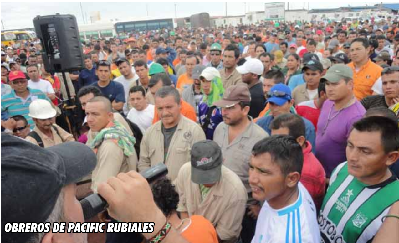
OBREROS DE PACIFIC RUBIALES