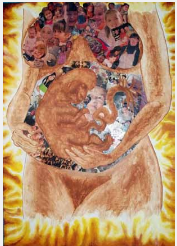
Renace De Las Cenizas Gestora De Esperanza Faxi2011