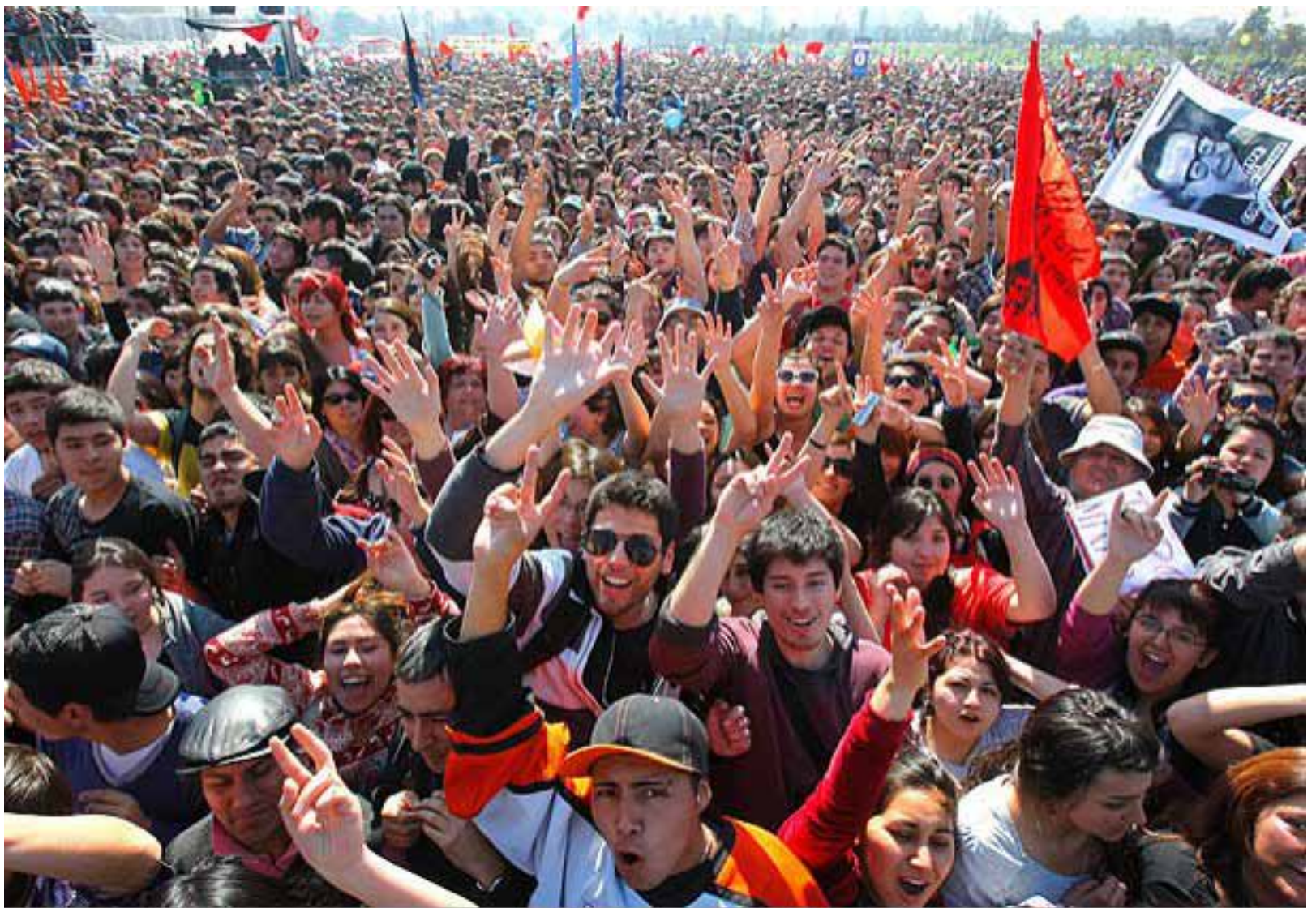
De la Huelga Política en Chile

¡Abajo el Podrido Estado Burgués y sus Elecciones: Viva el Futuro Estado de Obreros y Campesinos!