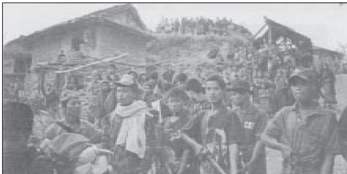
Las Masas Armadas son las protagonistas de la Guerra Popular en la aldea de Rukum, Nepal