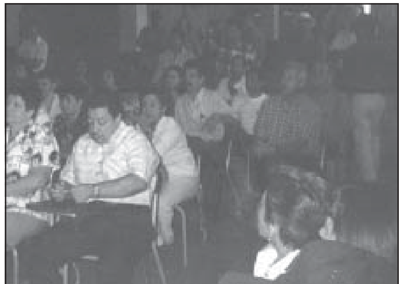
Obreros de Grulla en Asamblea

(Redactado sobre la base de informes detallados enviados por obreros de Grulla, a quienes pedimos disculpas, por no haber podido publicar antes su importante denuncia)