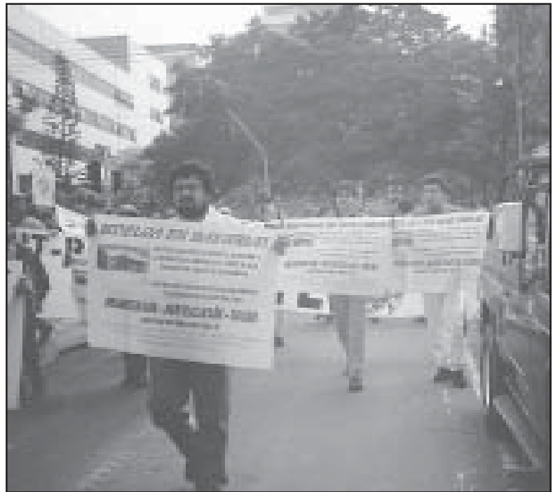
Marcha de los trabajadores Bavarios por la carrera 7a

unión con el movimiento obrero a través de la lucha directa, clase contra clase.