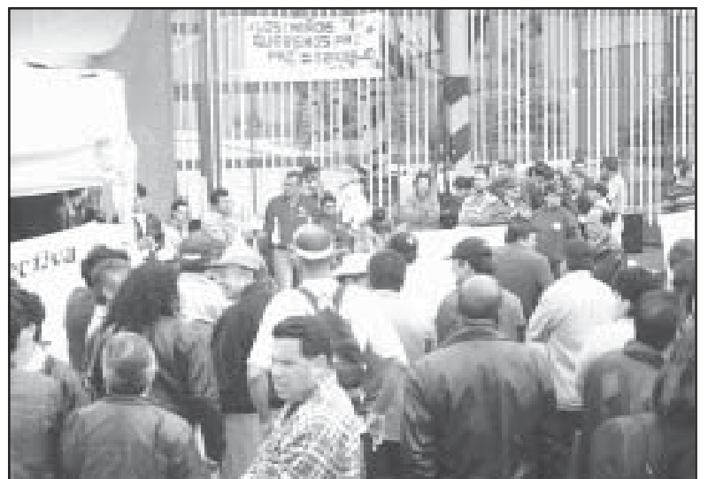
Reunión del intersindical en apoyo a la huelga de Bavaria

Pero tan grande sorpresa se llevaron los trabajadores al llegar a la fabrica, los estaban esperando dos tanquetas de guerra, policías y ejército armados hasta los dientes, posteriormente llegan más «efectivos», un camión con más soldados del ejercito, policía en motos, y mujeres policías, además de tener un paramilitar como lo llamaron los mismos obreros dentro de la fábrica con cámara en mano filmando a todos los manifestantes, es decir todo un operativo montado al más alto nivel militar para combatir un mitin de cerca de 100 obreros con pancartas, chapolas, megáfonos y sus elocuentes voces combativas, ellos no tenían tan siquiera una sola piedra para en el caso necesario defenderse. Un obrero decía, «sería que les informaron mal o pensaron que iban a llegar los paras o la guerrilla y se equivocaron»? y otro decía «estoy seguro que ni siquiera en los pueblos donde son masacrados campesinos, mujeres y niños llegan tantos «efectivos» a combatir. Por todo esto, podemos preguntarnos, ¿por qué se les permite a los dueños de Bavaria producir esta cerveza en Leona, aún cuando la ley lo prohíbe formalmente, y es