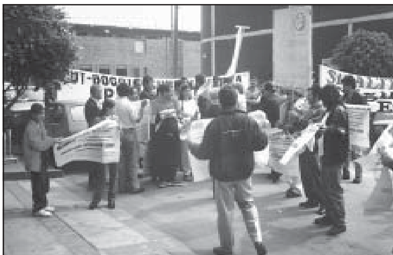
Mitin exigiendo imparcialidad y difusión del conflicto, frente a sede de Radionet

1. Evitar el cerco que nos está tendiendo la burguesía, a través del desprestigio a la huelga, pretendiendo oponer a los tenderos y esquirolas en contra de los huelguistas y rematar con el desalojo de las carpas si no logran que se entregue la huelga. Para esto hay que luchar en contra del aislamiento no sólo local como hasta ahora se ha hecho, sino también nacionalmente. Se debe sacar la huelga de las carpas, este conflicto se resuelve en