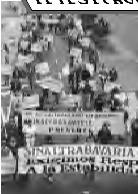
Los trabajadores realizan marchas como parte de la huelga en Bavaria y buscando unir su lucha a la de toda la clase obrera

Más de 6.000 trabajadores en Bavaria han completado 44 días de combativa huelga, defendiendo su convención colectiva. Es un conflicto transcendental porque no sólo se enfrenta al pulpo empresarial Santo Domingo sino también al Estado burgués terrateniente socio del imperialismo y es aquí donde radica su importancia.