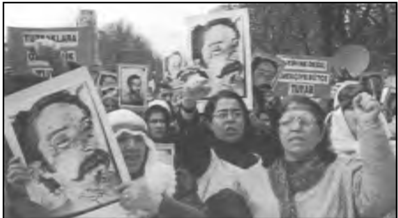
Estambul, Turquía: Protesta contra los penales tipo F, 1o. de Diciembre

La traducción al español es del Periódico "Obrero Revolucionario" de Estados Unidos.